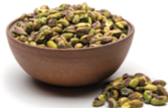
Pistache Torrado e Salgado R$ 9,90 | 100g