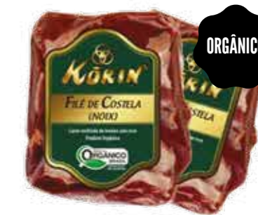
Filé de Costela Noix Bovina Korin R$ 59,90 | Kg