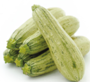
Abóbora Italiana R$ 2,49 | Kg