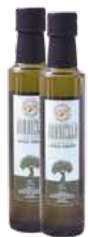
Azeite Extra Virgem Borriello R$ 45,90 | 250ml

Do arroz com feijão, ao couscous marroquino. Dos molhos, azeites e mix de temperos às geleias especiais. Uma seleção de ingredientes especiais e temperos, para dar vida às suas criações culinárias.