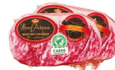
Beef de Chorizo Grand Passion Wagyu R$ 229,90 | Kg