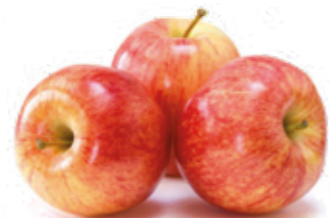
Maçã Fuji R$ 7,49 | Kg