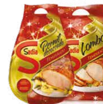
Lombo ou Pernil Temperado Sadia R$ 23,90 | Kg