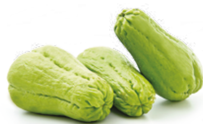
Chuchu R$ 2,49 | Kg