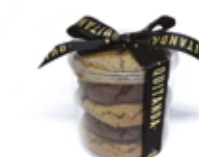
Cookies c/ Gosta de Chocolate R$ 9,90 | 200g