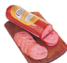
Lombo Canadense Ceratti R$ 2,99 | 100g