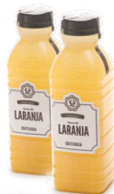
Suco de Laranja da Quitanda R$ 5,49 | 500ml R$ 9,90 | 1l

Segunda a Sexta · 7h30 às 22h Sábados e Domingos · 8h às 21h Feriados · 8h às 20h