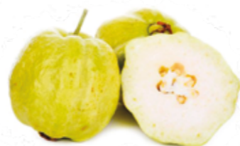
Goiaba Branca R$ 6,99 | Kg