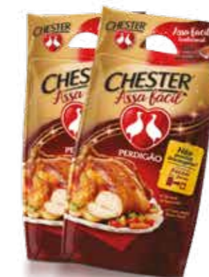
Chester Assa Fácil Perdigão R$ 19,90 | Kg