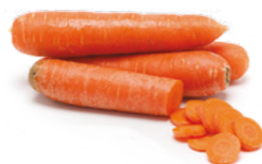
Cenoura R$ 2,99 | Kg