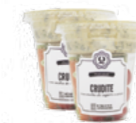
Crudites com Iogurte e Ervas R$ 9,90 | 150g