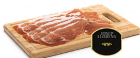
Presunto Cru Serrano Josep Llorens R$ 12,90 | 100g