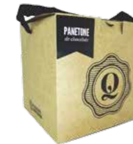
Cereja Importada R$ 4,99 | 100g