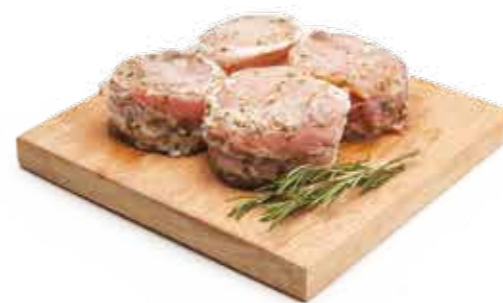
Medalhão de Frango c/ Bacon R$ 23,90 | Kg

Uma grande diversidade de cortes, manipulados sob rigoroso padrão de qualidade, para oferecer sempre o produto perfeito.