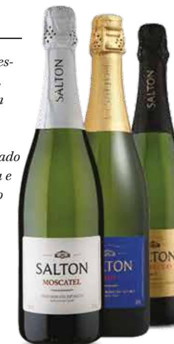
Espumante Salton *Prosecco, Brut ou Moscatel R$ 29,90 | 750ml

O Prosecco tem aroma frutado, expressando notas de maçã, pera e cítricos, além de algumas nuances florais. Em boca, é leve e refrescante, com uma acidez bem integrada, já o moscatel possui dulçor perfeitamente equilibrado com a acidez. Sua espuma é cremosa e envolve todo o seu paladar, deixando uma agradável sensação frutada em boca.