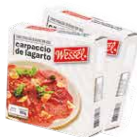
Carpaccio de Lagarto Wessel R$ 14,90 | 200g