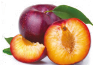
Ameixa Rubimel R$ 9,90 | Kg