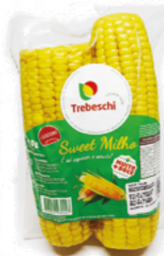
Milho Doce Pré Cozido R$ 5,99 | 450g