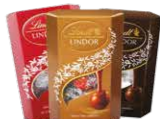
Chocolate Suíço Lindt Lindor *Milk, Dark ou Assorted R$ 39,90 | 200g/201g/202g