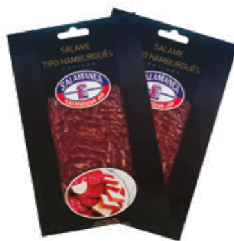
Salame Hamburgues Salamanca R$ 9,90 | 100g