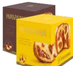
Panettone Havanna *Doce de Leite ou Chocolate c/ Doce de Leite R$ 49,90 | 700g

Segunda a Sexta · 7h30 às 22h Sábados e Domingos · 8h às 21h Feriados · 8h às 20h