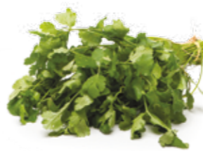
Coentro R$ 2,19 | Un