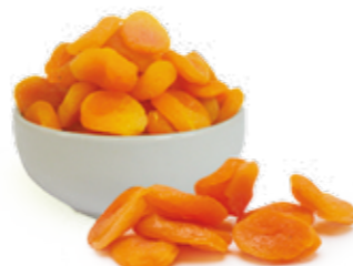
Damasco Seco Doce R$ 3,99 | 100g