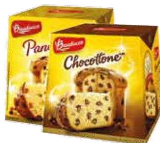
Panettone Bauducco *Frutas ou Chocottone R$ 17,90 | 500g