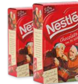
Chocolate em Pó do Padre 50% Cacau Nestlé R$ 11,90 | 200g