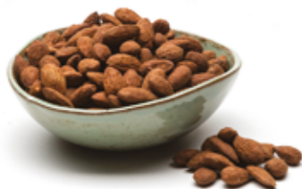
Amêndoa Chilena Defumada *Salgada R$ 9,99 | 100g