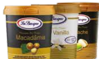
Sorvetes La Basque *Diversos Sabores R$ 29,90 | 500ml