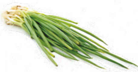
Cebolinha Verde R$ 1,99 | Un