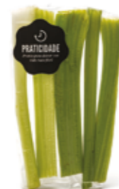
Salsão Talo da Quitanda R$ 2,39 | 100g