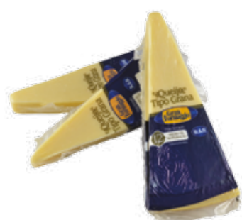
Queijo tipo Grana Gran Formaggio R$ 9,99 | 100g

Entre uma grande variedade de queijos e frios de qualidade, do peito de peru cortado em fatias finíssimas ao salame italiano, do queijo prato ao queijo minas inconfundível, além de manteigas, requeijões e patês, oferecemos tudo o que você precisa para um lanche cheio de sabor ou para aquela ocasião especial.