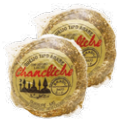
Queijo Chanchiche c/ Zattar R$ 12,90 | 135g