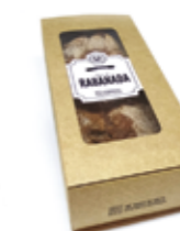
Bolo de Rabanada R$ 2,99 | 100g