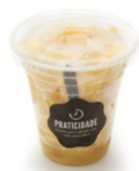
Manga em Cubos da Quitanda R$ 5,49 | 220g