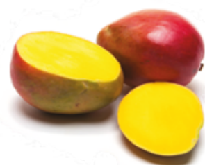
Manga Tommy R$ 3,99 | Kg

Buscamos e selecionamos o que há de melhor na roça e no campo para que possamos oferecer frutas, legumes e verduras sempre fresquinhos, nutritivos e saborosos