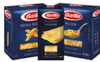
Massas Barilla *Spaghetti Integrale, Mini Penne Rigate, Farfalle, Penne Rigate, Rigatoni, Fusilli, Risoni ou Lasagne R$ 9,90 | 500g/250g