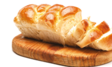
Brioche Tradicional R$ 2,19 | 100g