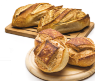
Pão Italiano Filão ou Redondo R$ 4,99 | 400g