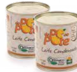
Leite Condensado Do Pé ao Pote R$ 14,90 | 380g