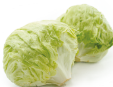
Alface Americana R$ 3,59 | Un