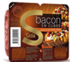
Bacon em Cubos Sadia R$ 9,90 | 140g