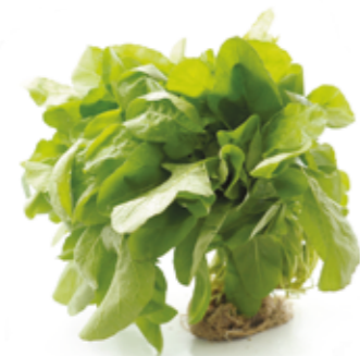
Rúcula R$ 3,49 | Un