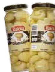
Champignon Raiola *Inteiro ou Fatiado R$ 11,90 | 180g