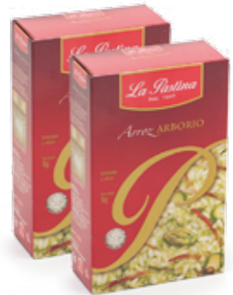
Arroz Arbório La Pastina R$ 16,90 | 1kg