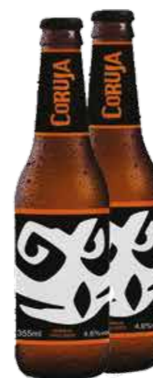
Cerveja Coruja Lager R$ 5,99 | 355ml

Uma combinação especial entre sabor adocicado e aroma floral de lúpulos. Cerveja lager leve que reflete a personalidade, a diversidade e a autenticamente brasileira.