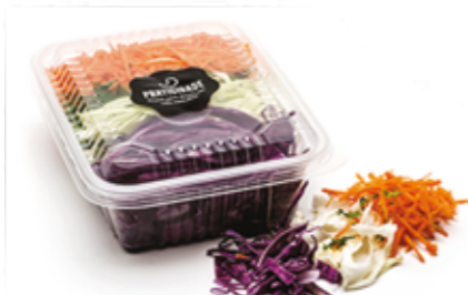
Mix Coleslaw da Quitanda R$ 1,69 | 100g