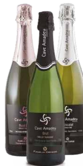
Espumante Cave Amadeu *Brut, Moscatel ou Brut Rosé R$ 45,90 | 750ml

As condições climáticas e o solo da Serra Gaúcha favorecem a produção da acidez das uvas, a qual é essencial para balancear a doçura deste espumante. Leve e agradável, pode ser apreciado a qualquer hora do dia.