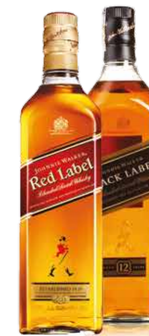
Whisky Johnnie Walker Red Label R$ 75,90 | 1l Whisky Johnnie Walker Black Label R$ 129,90 | 1l

Red Label dispensa apresentações. É o whisky escocês mais vendido no mundo. Bastante versátil e pode ser consumido com gelo ou em coquetéis.