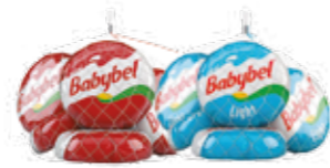
Queijo Francês Babybel Mini *Tradicional ou Light R$ 11,90 | 110g