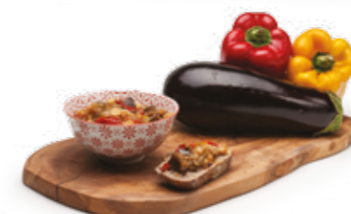
Caponata de Berinjela R$ 4,99 | 100g

Uma seleção de produtos desenvolvida com todo cuidado e carinho, utilizando as melhores matérias-primas, para facilitar o seu dia-a-dia, seja no preparo de suas receitas ou desfrutando todo o sabor e praticidade de um de nossos pratos.