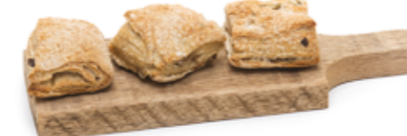
Ciabatta c/ Azeitona R$ 2,29 | 100g