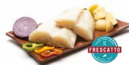
Lombo de Bacalhau Frescatto *Dessalgado R$ 54,90 | 680g