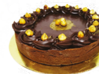
Panettone de Frutas Quitanda R$ 21,90 | 500g Panettone de Chocolate Quitanda R$ 25,90 | 500g

Segunda a Sexta · 7h30 às 22h Sábados e Domingos · 8h às 21h Feriados · 8h às 20h